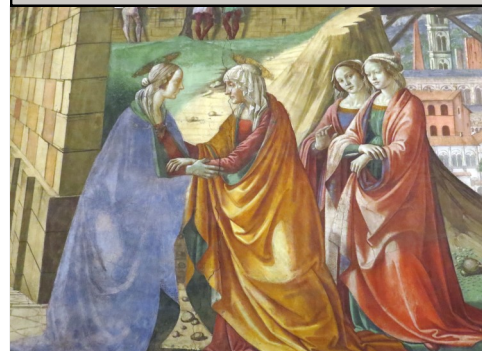
Firenze: Cappella Tornabuoni Visitazione del Ghirlandaio

I n quei giorni Maria si alzò e andò in fretta verso la regione montuosa, in una città di Giuda.